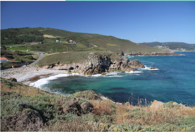
Praia da Ucha