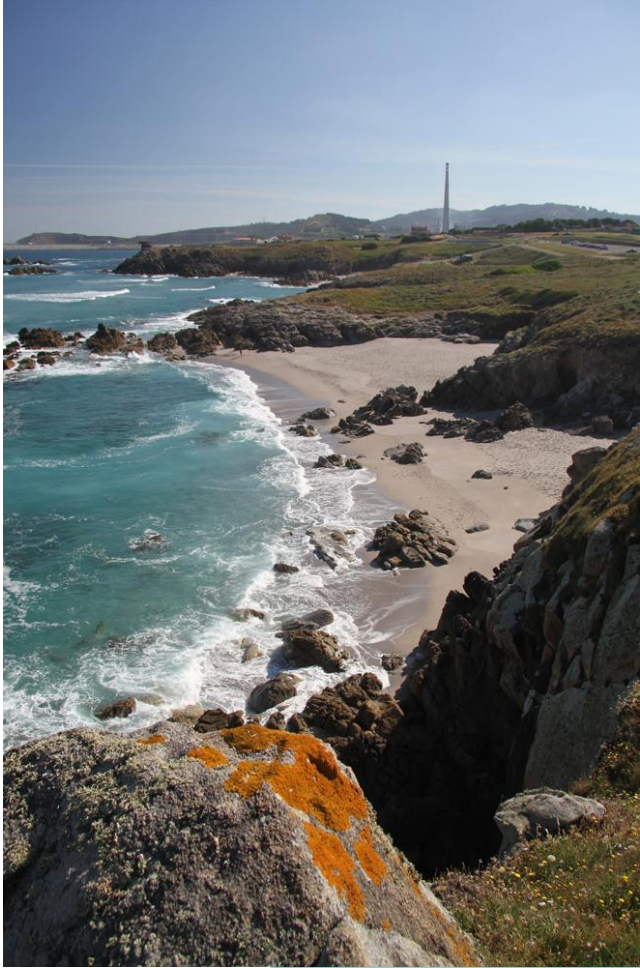
Praia da Salsa