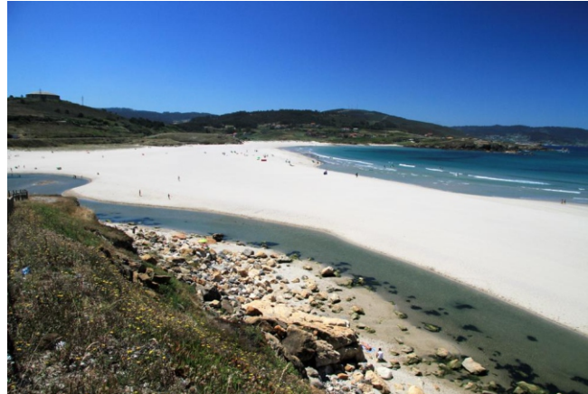
Praia de Sabón e río de Seixedo