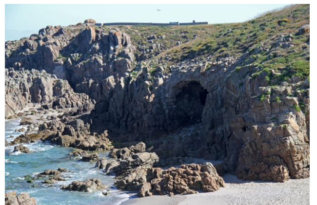
Praia de Repibelo