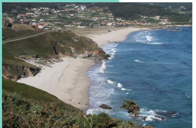
Praia das Combouzas