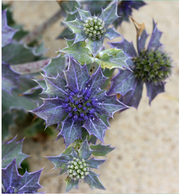
Cardo da ribeira ( Eryngium maritimum )