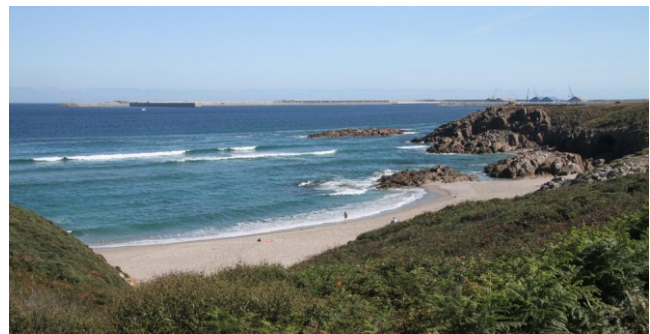
Praia de Repibelo