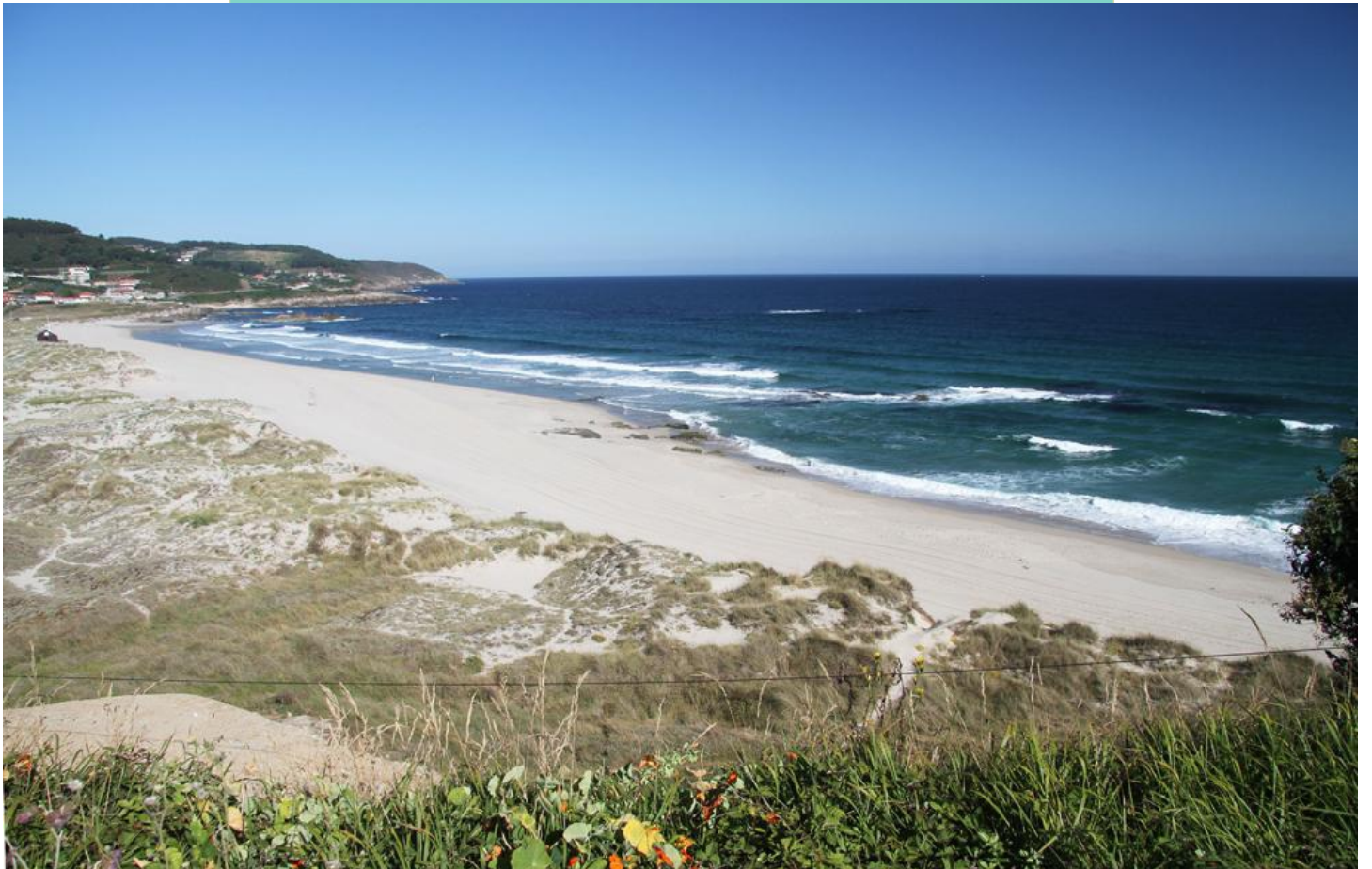
Praia de Barrañán