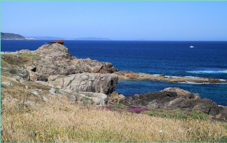
Punta dos Castelotes e “monumento ao voyeur”