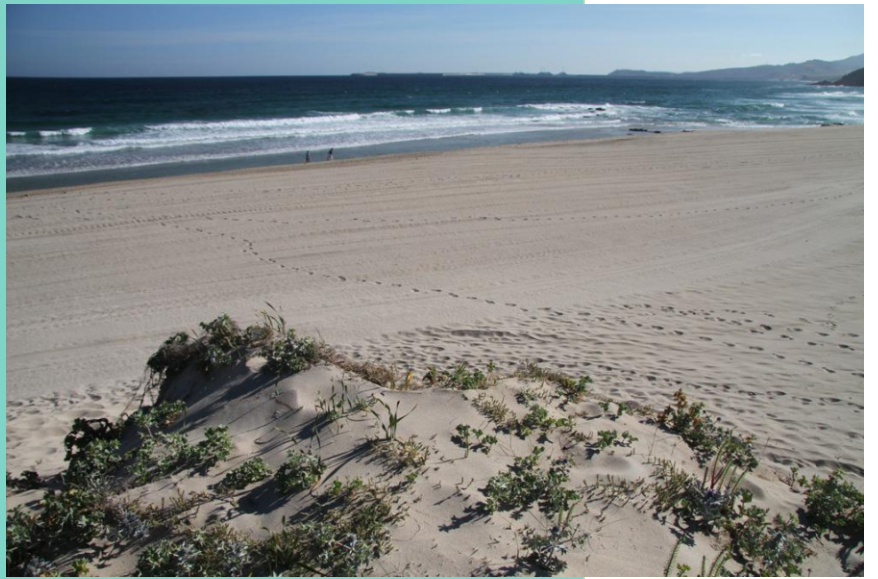
Praia de Barrañán