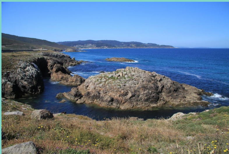
Pedra da Herba