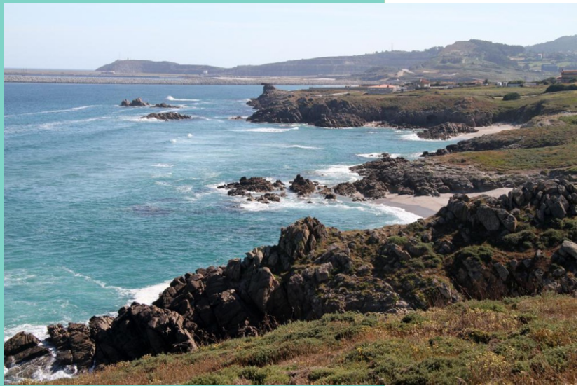
Vista desde Punta Corveira