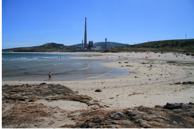
Praia de Sabón