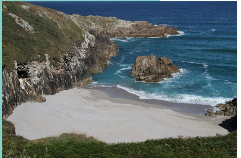
Praia e Punta Corveira