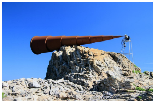
Monumento ao "voyeur"