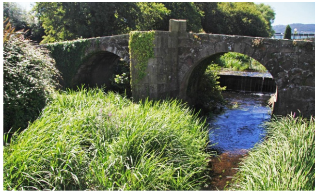
Ponte dos Brozos sobre o río Bolaños

Comezamos o percorrido en Arteixo, no paseo fluvial, camiñando por debaixo da zona deportiva, acompañando ao río no seu escoar cara ao mar, un pouco máis alá da metade do paseo chegamos á ponte dos Brozos unha antiga construción de dous arcos pola que se cruzou o río durante séculos como mostran as fondas rodeiras que os carros deixaron gravadas nas súas pedras, cruzamos a estrada e continuamos o camiño ata o final do tramo acondicionado, ao pé da estación de bombeo, volvemos a cruzar a estrada e o río pola ponte para pasar ao outro lado e facer un tramo de enlace que a través do lugar do Rañal e a estrada nos achega á praia de Sabón, un magnífico areal, ao abrigo das puntas dos Castelotes e a Cancela, no que desembocan, a unha e outra banda, os ríos Seixedo e Bolaños; cruzando o río Bolaños pola ponte de madeira do paseo entramos na ruta e seguimos a camiñada agora xa todo o tempo máis ou menos preto do mar, empezando pola punta dos Castelotes na que atopamos o curioso “monumento ao voyeur” e a partir de aquí subindo e baixando para ir ás puntas imos descubrindo en cada volta unha praia: Ripibelo, a Salsa, a Ucha, Valcovo, e despois dunha longa subida saímos á estrada por enriba da de Combozos e descubrimos por diante dela a de Barrañán onde rematamos o percorrido. Desde alí temos que procurar unha maneira de volver á vila da que nos separan 3,5 km que tamén podemos facer camiñando case todo o tempo por unha beirarrúa pola beira da estrada.