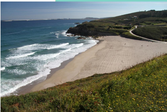
Praia de Valcovo